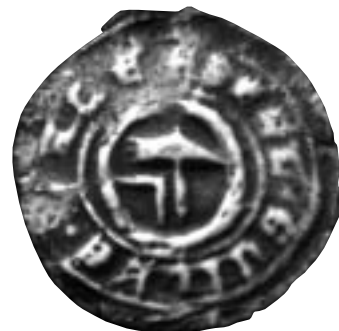
Sceau de Guillaume Halle, 1371.

On peut enfin remarquer que les sceaux dont la réalisation est la plus fine et surtout la plus proche des formes héraldiques traditionnelles sont ceux émanant des maçons ayant le statut social le plus