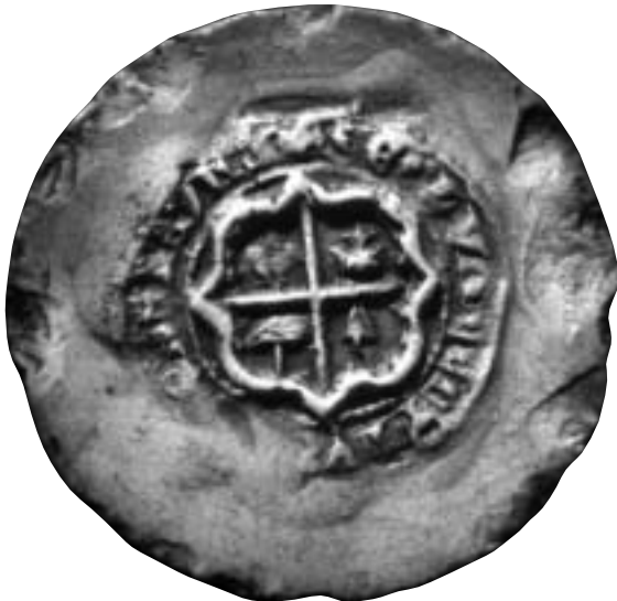
Sceau de Vincent du Bourg la Reine, 1349.