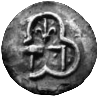
Sceau de Michel Mote, 1372.