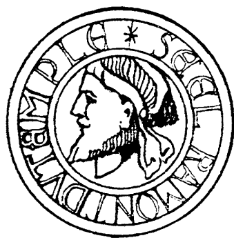
Sceau de Raymond du Temple, 1372. D'après le dessin d'Adolphe Lance, in Dictionnaire des architectes français .