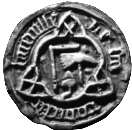
Sceau de Robert de Layeville, 1433.